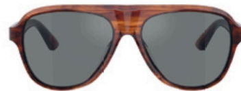
Les nostalgiques de Paul Newman ne passeront pas à côté de cette réédition d'une de ses lunettes favorites par Oliver Peoples.