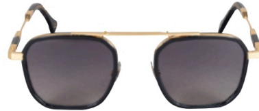
Fusion parfaite entre rétro et modernité, les IRS 57 de la collection Ytzo de Iron Paris sont disponibles aussi en argent mat antique ou marron brillant.