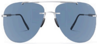
Monture ultra light en titane pour ces aviateurs, Silhouette chez Meyrowitz.