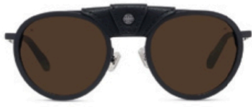
Les fameuses glaciers de Vuarnet se portent désormais en ville.