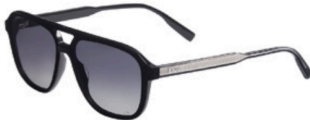
Avec la DioRibbon A11, Dior revisite les aviateurs avec succès.