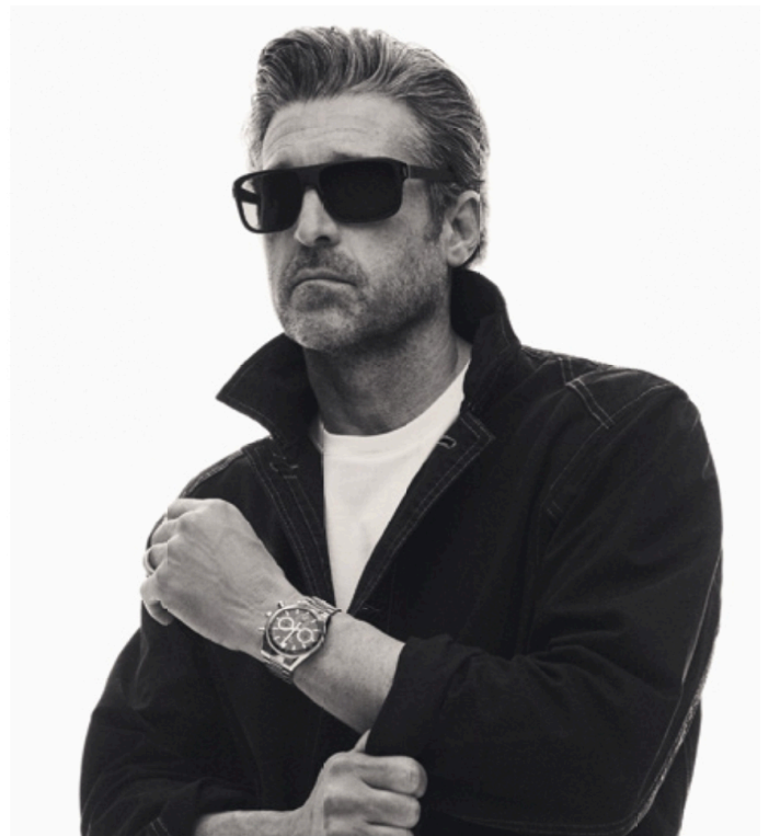
La nouvelle collection de solaires TAG Heuer au look résolument sportif : idéales pour la conduite comme en témoigne l'acteur et pilote Patrick Dempsey.